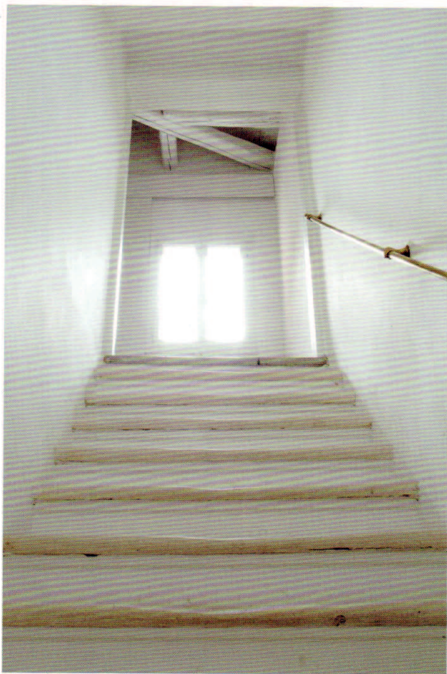
Il corpo scala, unico elemento strutturale mantenuto nel recupero, percorre verticalmente tutti i livelli, in pietra d'Istria, molto luminosa e cromaticamente in sintonia con resto della casa. La luce accecante che entra dalla finestra è schermata dalle tende.